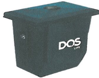
ถังดักไขมันแบบฝังดิน