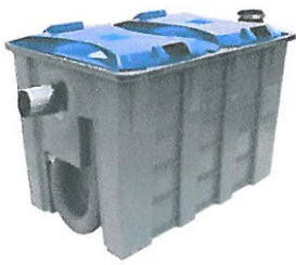
ถังดักไขมันแบบคั้งพื้น